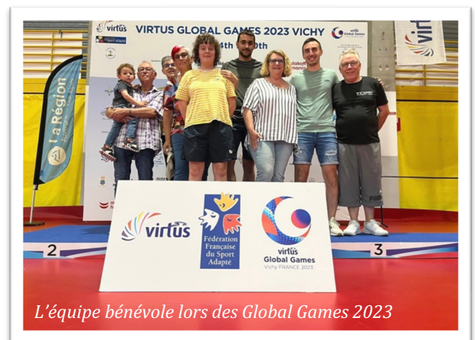
L'équipe bénévole lors des Global Games 2023

Enfin, le sport santé, notamment à travers la pratique du Ping VR, dont le club est équipé, doit être un levier à activer.