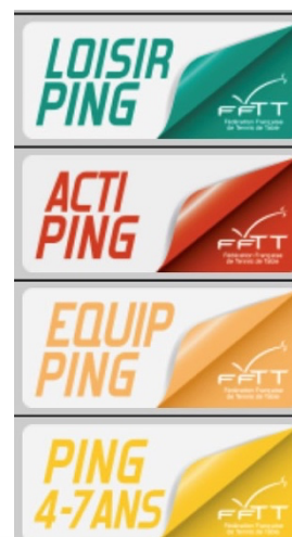
Club labélisé FFFT

Par ailleurs, des formations d'entraîneurs et d'arbitres sont régulièrement organisées par le comité départemental.