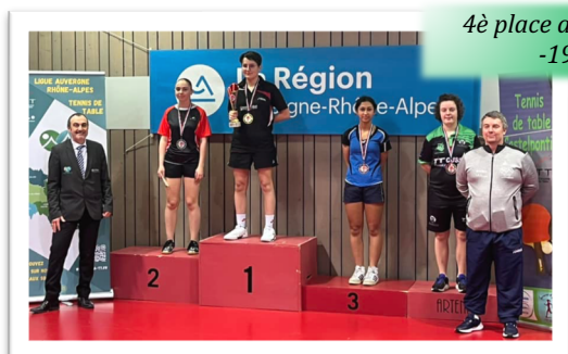
4 e place au championnat AURA -19 ans féminines

Au niveau « loisir », les créneaux « Ping pour tous » fonctionnent bien et se développent.