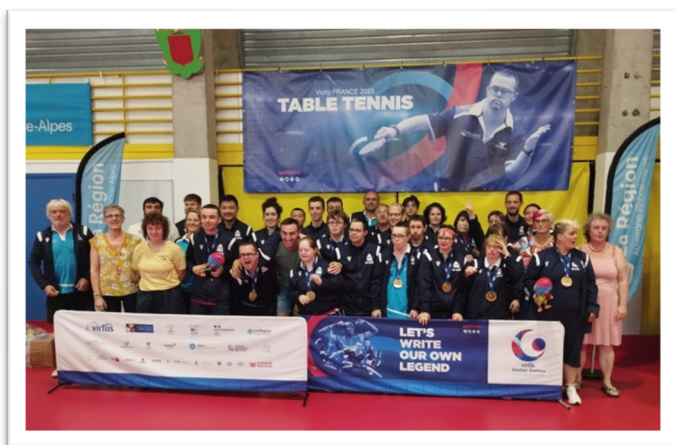
Global Games tennis de table 2023