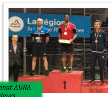
3 e place au championnat AURA Vétérans 1 messieurs